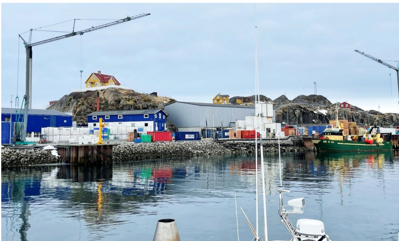
Takussutissiaq 2 Figur 2

Denne lokalplan har, som forslag, været fremlagt til høring i X uger, fra d. xxxx til den xxx og er tilrettet efter modtagne bemærkninger. Ved indsigelsesfristens udløb er der (ikke) fremsat (indsæt antal) indsigelser imod lokalplanen.